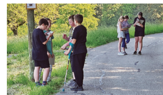
An manchen Posten war einiges an gedanklicher Arbeit verlangt.

Am Mittwoch, 31. Mai, machten die 5.-/6.-Klässler von Fehren im Religionsunterricht einen Postenlauf in der freien Natur. Sie mussten entlang des Waldrands, beginnend beim Sportplatz, diverse Orte und Sachen auffinden, um in einer kleinen NT-Ausgabe verschiedene Bibelstellen aufschlagen zu können. Für die einen war es leicht, für die anderen schwierig, aber der Postenlauf als Rundgang um den