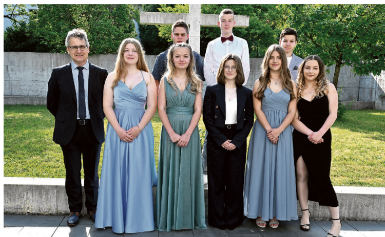
Die Konfirmanden unmittelbar vor dem Konfirmationsgottesdienst am 4. Juni.

Bärschwil – Beinwil – Breitenbach – Büsserach – Erschwil – Fehren – Grindel – Himmelried – Meltingen – Nunningen – Zullwil