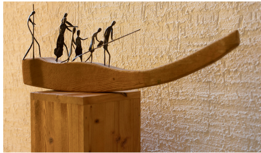
«Schiff» in der Ökumenischen Kirche Flüh.

Denn ist nicht genau das etwas, was uns unglücklich macht – wenn nie etwas gut genug ist?