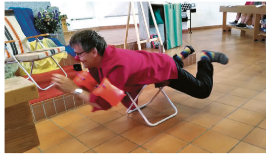
Schwimmflegeli fürs Trockenbaden am Strand, wenn der Clown nicht schwimmen kann.