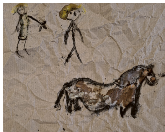
Eines der gemalten Tiere auf Packpapier, das an wirklichen Felsen erinnert.