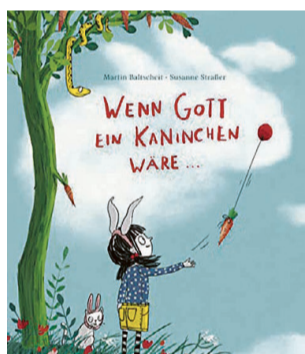
Cover des Bilderbuchs.