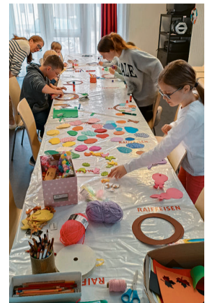
Die Papierkränze fürs Fenster entstehen.