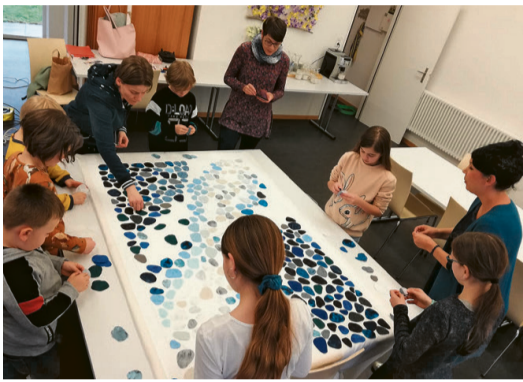
Beim Legen der vielfältigen blauen Steine.