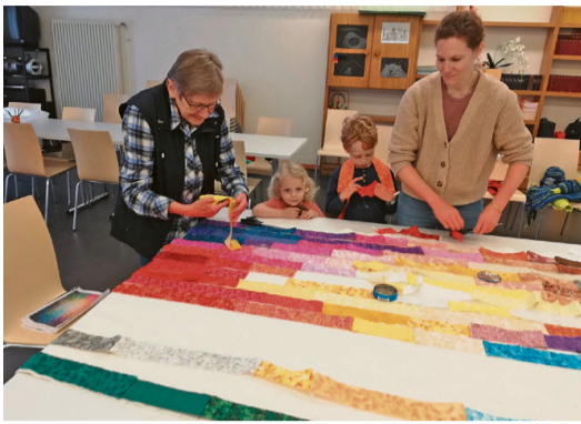
Aneinanderlegen von Farbverläufen.