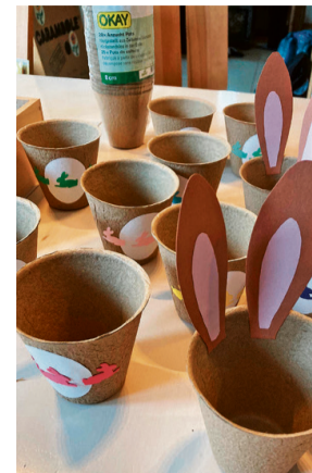
Beim Basteln am Sonntag, 19. März.

Am Sonntag, 19. März , und am Karfreitag, 7. April , bastelten die Kinder in der Sonntagsschule Osterdeko für die Familienfeier am Karsamstagabend, 8. April . Schmucke Papierkränze und Eierbecher kamen dabei heraus. Die Papierkränze wurden an die Fenster zum Innenhof der Kirche gehängt, und die Eierbecher kamen bei der Eiertütschete zum Einsatz. Es war toll, dass so viele Eltern und Kinder dabei mitmachten! Herzlichen Dank!