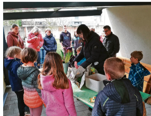
Von den Kindern und den Erwachsenen eingetopfte Pflanzen für die Feier.