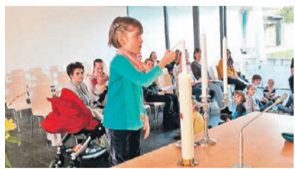
Unser Fiire mit de Chliine beginnt mit dem Anzünden der Kerzen.