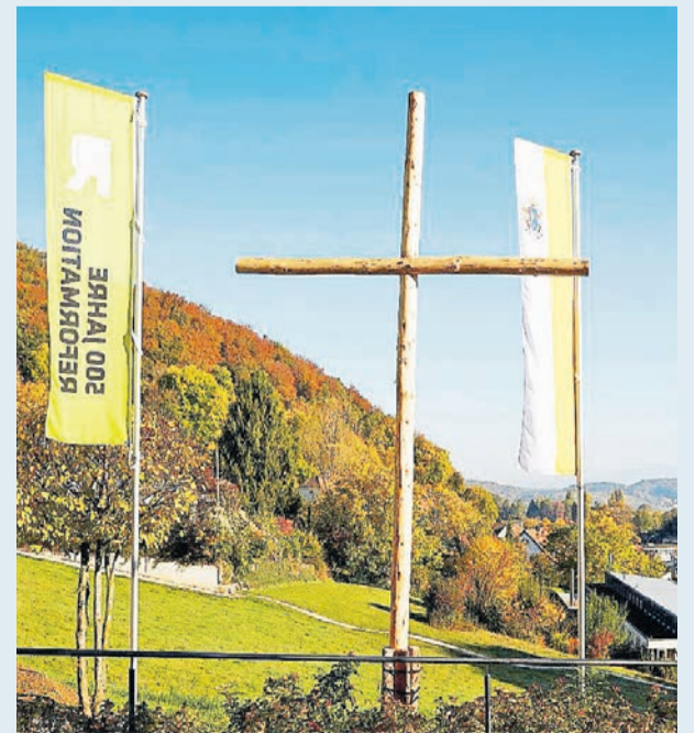
Im November und Dezember 2017 schmückten ein Kreuz und zwei Flaggen den Fussweg zur ökumenischen Kirche: Die Flagge zu 500 Jahre Reformation, die Vatikanflagge mit dem Wappen von Papst Franziskus und in ihrer Mitte ein schlichtes Holzkreuz, aufgestellt von der Forstgemeinschaft am Blauen. Das Kreuz gibt beiden Flaggen ihren Ort und ihre Würde in Christus.